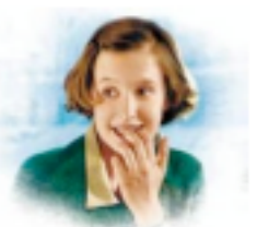
La femme de chambre, Louise?