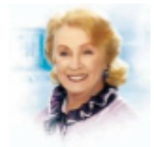
Sa belle-mère, Mamie?