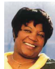
La cuisinière, Chanel?